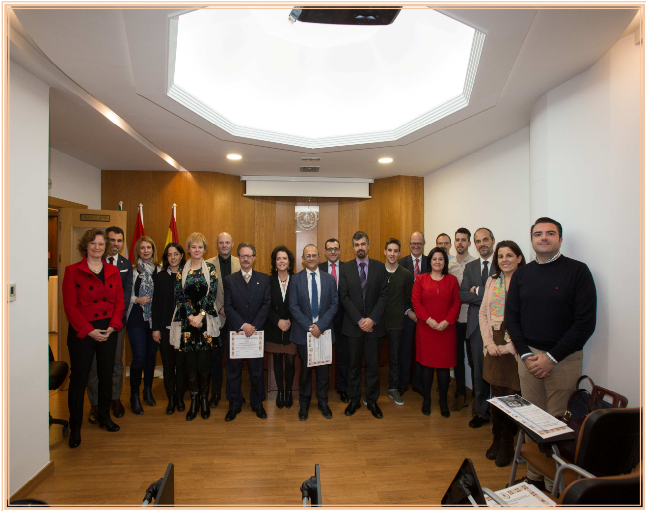
Fotografía de grupo de profesores y alumnos